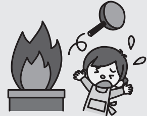
料理中にヤケドをしたとき