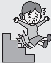
駅の階段で転倒しケガをしたとき