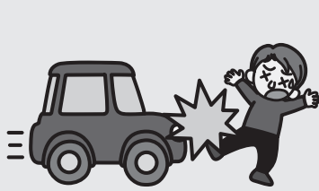
交通事故でケガをしたとき