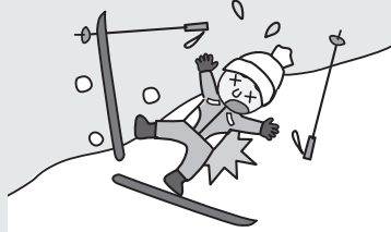
スポーツ中ケガをしたとき