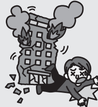
地震で瓦礫の下敷きになりケガをしたとき