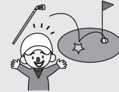
ホールインワン・ アルパトロス費用