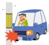
ドライブ中のケガ