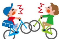
自転車との接触によるケガ