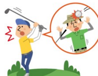
野球・ゴルフなどのボールが当たったケガ