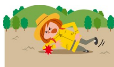
ハイキング中の事故によるケガ