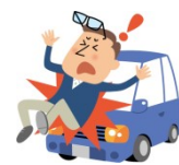
自動車にはねられてのケガ