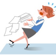
お仕事中、転んでのケガ