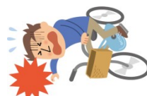
自転車で転んでのケガ